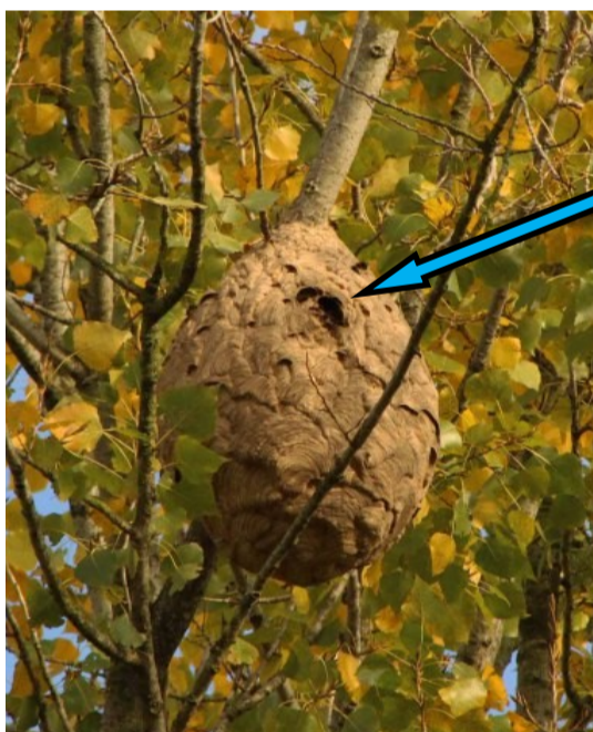
Trou d'entrée du nid sur le côté

peut atteindre 80cm de diamètre La plupart du temps dans les arbres à des hauteurs d'une quinzaine de mètres