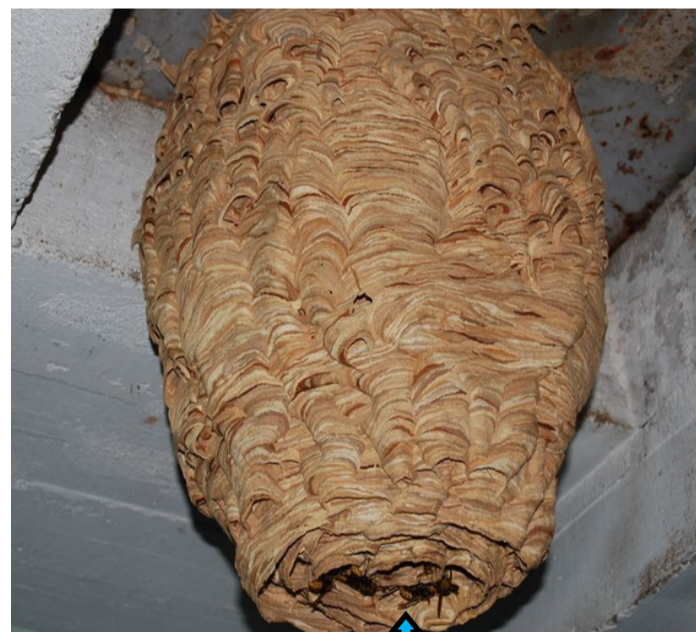
Trou d'entrée du nid au dessous

N'y touchez pas, prenez des photos PREVENEZ LA MAIRIE